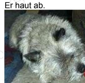
Ich schmelze dahin.