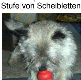
Was wohl heute drin ist?