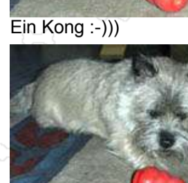
Er haut ab.