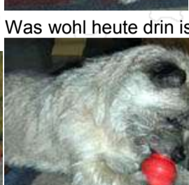
Jetzt aber mit Gewalt.