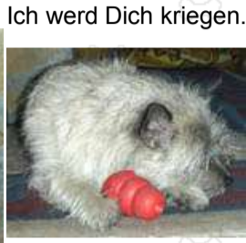
Konged out ...