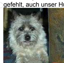
Ein Kong :-))