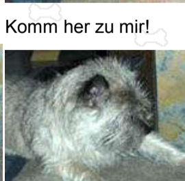
Ich werd Dich kriegen.