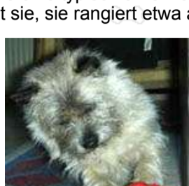
Komm her zu mir!